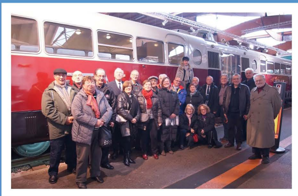
Le dernier autorail Bugatti rescapé

Cette présentation se fait en vrac avec des images qui montrent, entremêlés, des trains (autorail Bugatti) des vues du restaurant des animaux du zoo visibles dans un environnement botanique remarquable, le car et le verre d'adieu au Pur Sang