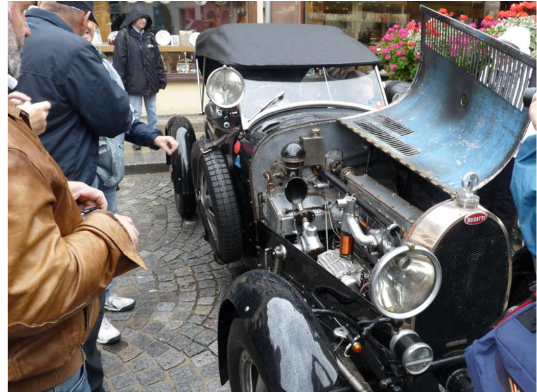
Le public pouvait admirer les moteurs des véhicules

► Les réjouissances se poursuivent ce dimanche avec le rassemblement à 9h au cimetière de Dorlisheim autour de la tombe d'Ettore Bugatti puis l'exposition des voitures au parc de Jésuites à Molsheim (10h-15h).